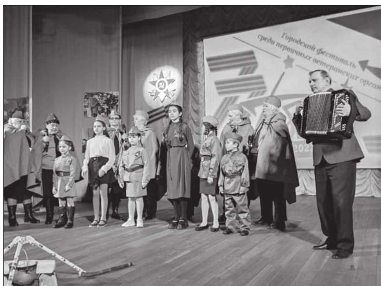
Ветераны вместе с внуками, жителями своих посёлков пели песни военной поры, читали патриотические стихи, представляли сценические миниатюры, отрывки из известных произведений о войне.

Это ветераны первичек: «Центр города», районов Пищеккомбинат и Совхоз-Галантуй, команда клуба «Ветераночка», микрорайона Ангарского, Транспортного посёлка, а также команда ветеранов администра-