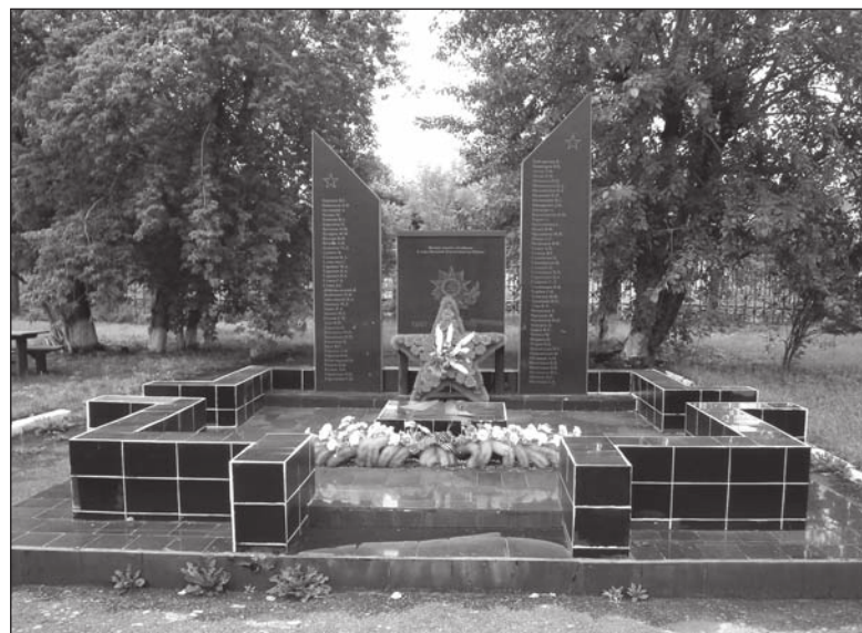
Мемориал на территории Локомотивного депо

Эта школа распахнула свои двери для учащихся 13 января 1966 года. Ей было присвоено имя Героя Советского Союза