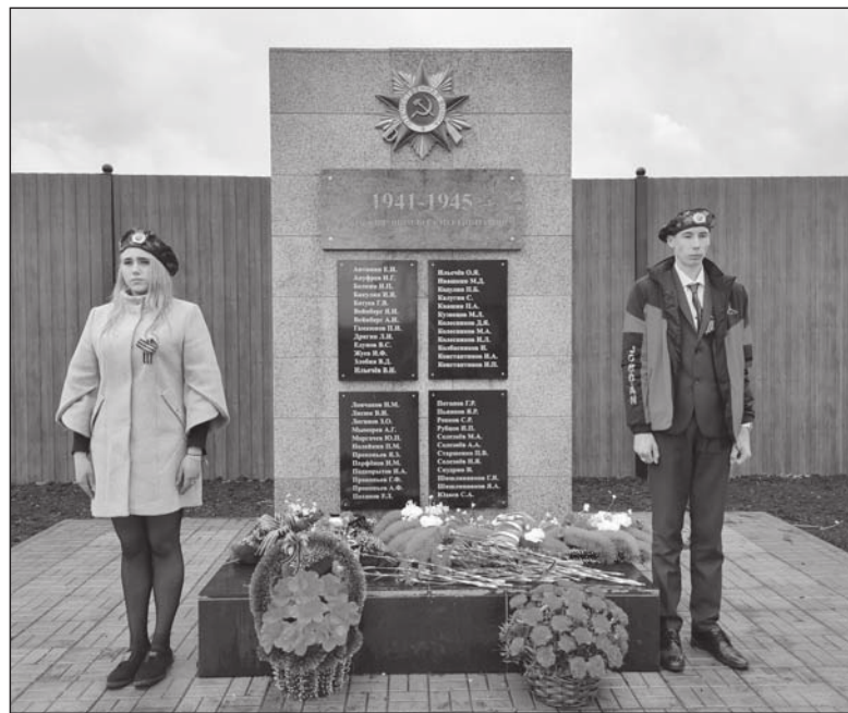
Памятник-обелиск участникам Великой Отечественной войны – жителям района Старой Зимы

В 1975 году, с постройкой нового здания школы № 9, на ее территории был поставлен обелиск жителям района Старая Зима, погибшим в боях с фашизмом в годы Великой Отечественной войны. К сожалению, фотографий обелиска не сохранилось. Обелиск не сохранился до наших дней, а мемориальная доска была перенесена в здание школы. В год 75-летия Великой Победы в 2020 году по адресу: ул. Калинина, 57, был установлен обелиск в память о 49 погибших во время Великой Отечественной войны зиминцах.