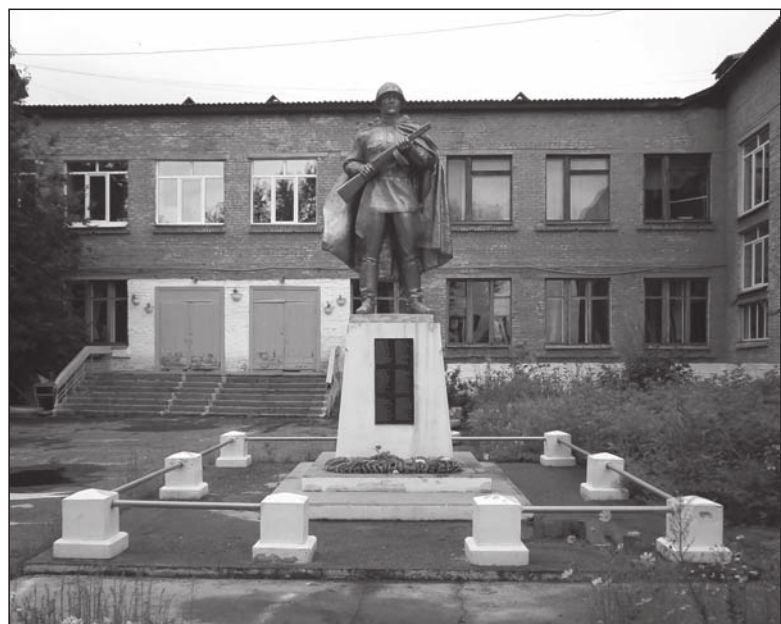
Памятник Неизвестному солдату на территории школы № 8

Работники Библиотечной системы города Зимы проводят историко-краеведческие экскурсии под названием «Памятники Победы и скорби». Молодому поколению и гостям города работники культуры рассказывают о героическом прошлом зиминской истории.