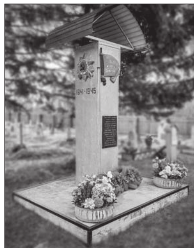
Обелиск на ул. Коминтерна